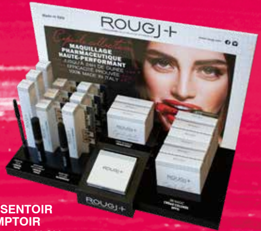
PRÉSENTOIR COMPTOIR 30 X 15 X 25H CM