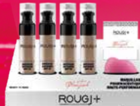
fond de teint beauty blender