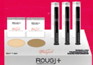
poudre - correcteur