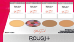
blush - terre