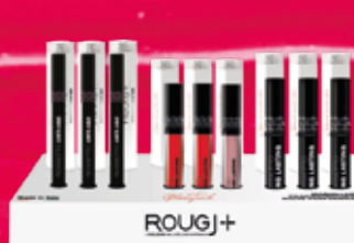
rouge à lèvres - liptint