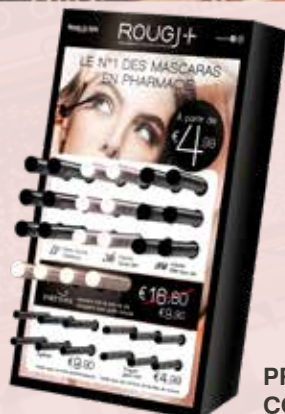
PRÉSENTOIR COMPTOIR 24 x 6 x 38h cm