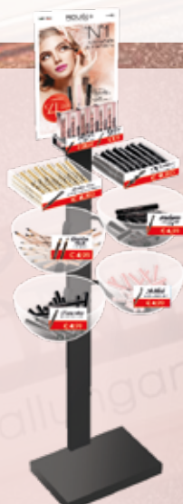
PRÉSENTOIR SOL 45 x 27 x 170h cm