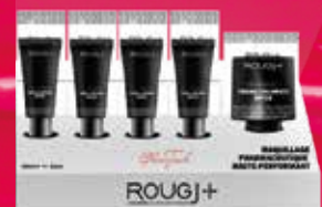
cc crème - bb crème