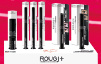
primer lèvres - crayon - mascara