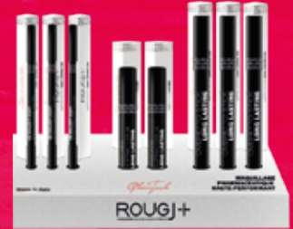
crayon - eyeliner ombre à paupières