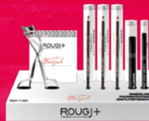
recourbe-cils - crayon sourcil