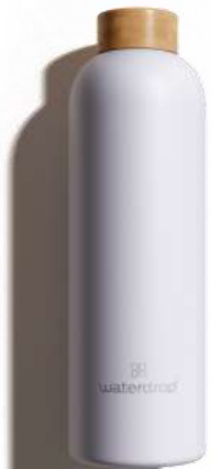
Pastel Violet Mat